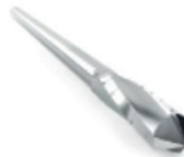
Cheilectomie, Exérèse des ostéophytes : Wedge Ø 3.1 x 13 mm

Shannon Larga Ø 3.0 x 20 mm (7cm) Shannon X-Larga Ø 3.0 x 30 mm (10cm)