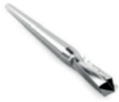
Orteils en griffe, Akinette :

Les fraises percutanées Novastep sont conçues spécifiquement pour les besoins de la chirurgie mini-invasive. Les fraises cylindriques et coniques sont fabriquées en acier inoxydable, très résistant à l'usure, offrant une qualité de coupe optimale.