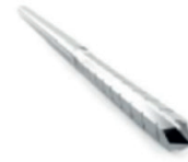
Ostéotomie de M1 :

Shannon Recta Ø 2.0 x 12 mm Shannon Hélicoïdale Ø 2.0 x 12 mm