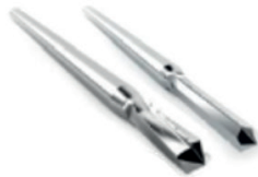
Akin, DMMO, DICMO, Bunionette :

Shannon Recta Ø 2.0 x 12 mm Shannon Hélicoïdale Ø 2.0 x 12 mm