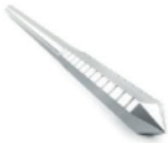
Ostéotomie calcanéenne :

Shannon Larga Ø 3.0 x 20 mm (7cm) Shannon X-Larga Ø 3.0 x 30 mm (10cm)