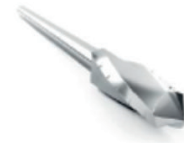
Cheilectomie, Exérèse des ostéophytes : Wedge Ø 4.1 x 13 mm